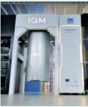
Der Quantencomputer

Klassische Computer nutzen Bits, um zu rechnen. So ein Bit kann nur zwei Zustände annehmen: „1“ oder „0“. Man sagt auch „an“ oder „aus“. Quantencomputer nutzen stattdessen Quanten-Bits. Diese können beide Zustände gleichzeitig annehmen und sogar noch unzählige Zustände dazwischen. Deshalb kann der Quantencomputer mehr rechnen als ein klassischer Computer.