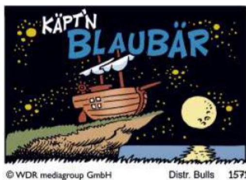
© WDR mediagroup GmbH Distr. Bulls 1571