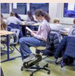
Das Sitz-Fahrad

Die ganze Zeit im Unterricht ruhig sitzen und arbeiten, das ist nicht so einfach. Eine Lehrerin an einer Schule in Hessen hat deshalb ein Sitzfahrad für ihre Schülerinnen organisiert. „Oben sollen sie ruhig sein und unten ihre Energie rauslassen“, erklärt sie. Das Bewegende soll den Schülerinnen dabei helfen, sich besser konzentrieren zu können. Das Sitzfahrad sieht aus wie ein Schreibtischstuhl, der kurz über dem Boden Pedale hat. Am Anfang fanden die Schülerinnen es peinlich, darauf zu sitzen. Inzwischen treten sie aber gern während des Unterrichts in die Pedale. Eine Schülerin sagt: „Ich bin morgens müde und damit kann ich gut wach werden.“