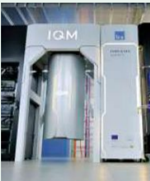
Der Quantencomputer

Klassische Computer nutzen Bits, um zu rechnen. So ein Bit kann nur zwei Zustände annehmen: „1“ oder „0“. Man sagt auch „an“ oder „aus“. Quantencomputer nutzen stattdessen Quanten-Bits. Diese können beide Zustände gleichzeitig annehmen und sogar noch unzählige Zustände dazwischen. Deshalb kann der Quantencomputer mehr rechnen als ein klassischer Computer.